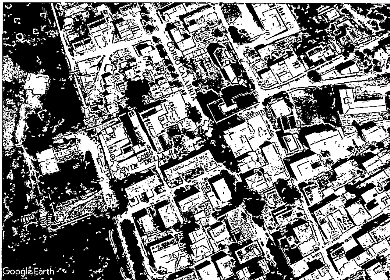
fig. 2 - STRALCIO ORTOFOTO

Visto lo stradario del Comune di Castrovillari con l'elenco dei toponimi;